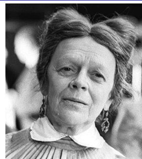
Это было признание!