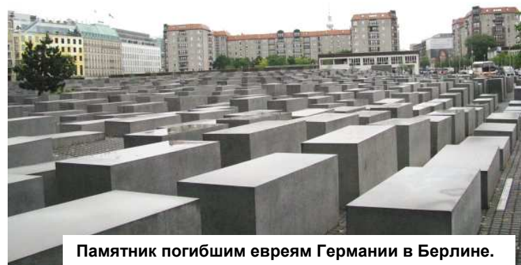
Памятник погибшим евреям Германии в Берлине.

Ежегодно в Международный день против фашизма, расизма и антисемитизма во многих странах проходят тематические мероприятия – выставки, митинги, демонстрации и другие акции в память о жертвах нацизма, жертвах террора на национальной, расистской, в частности, антисемитской почве.